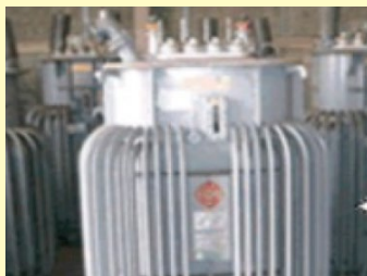
高圧トランス(変圧器)