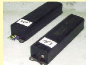
業務用蛍光灯の安定器