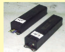
業務用・施設用蛍光灯の PCB含有安定器

古い照明機器、昭和52年3月以前の建物はPCB含有安定器が 使用されている可能性があります。