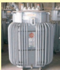
高圧トランス (変圧器)